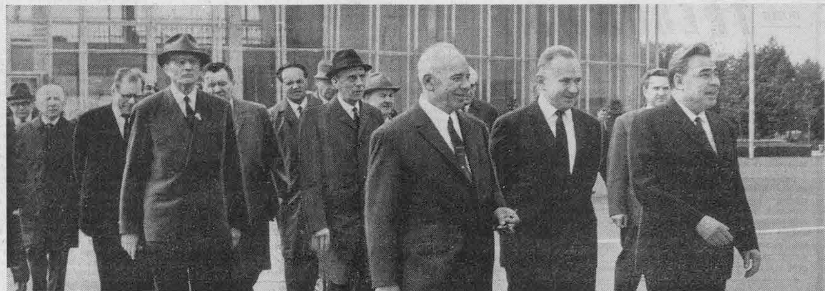
Москва. 21 июля в Варшаву по приглашению Центрального Комитета Польской объединенной рабочей партии и Государственного совета ПНР для участия в торжествах по случаю 25-летия народной Польши отбыли Генеральный секретарь ЦК КПСС Л. И. Брежнев и Председатель Президиума Верховного Совета СССР Н. В. Подгорный. На снимке: проводы на Внуковском аэродроме.

У БРАТСКОГО польского народа большой праздник: народная Польша — 25 лет. Вместе с трудящимися Польши этот знаменательный юбилей торжественно отмечают все их друзья. Советские люди от всей души поздравляют юбиларов и желают им новых больших успехов на широком пути строительства социалистического общества.